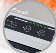
Comandi con luci LED