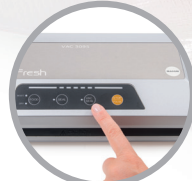
Pannello comandi soft touch