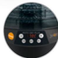
Display digitale con timer e selettore temperatura