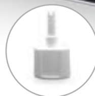
Adattatore per sottovuoto barattoli