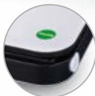
Pulsanti di sblocco